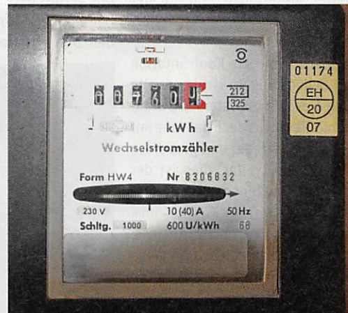
Dieser mechanische Elektrozähler wurde im Jahre 2007 geeicht und läuft 2023 nach 16 Jahren ab.